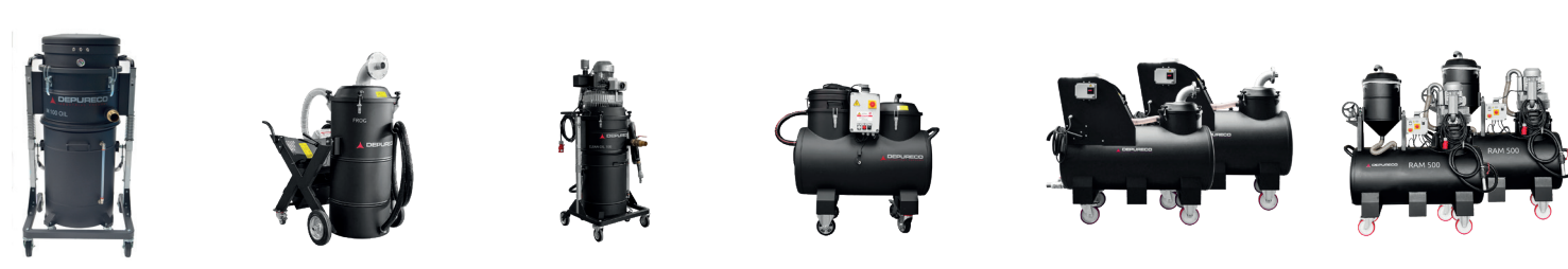
M100 OIL FROG CLEAN OIL RAM OIL 100 PUMP RAM OIL 500/1000 RAM OIL T500/T555