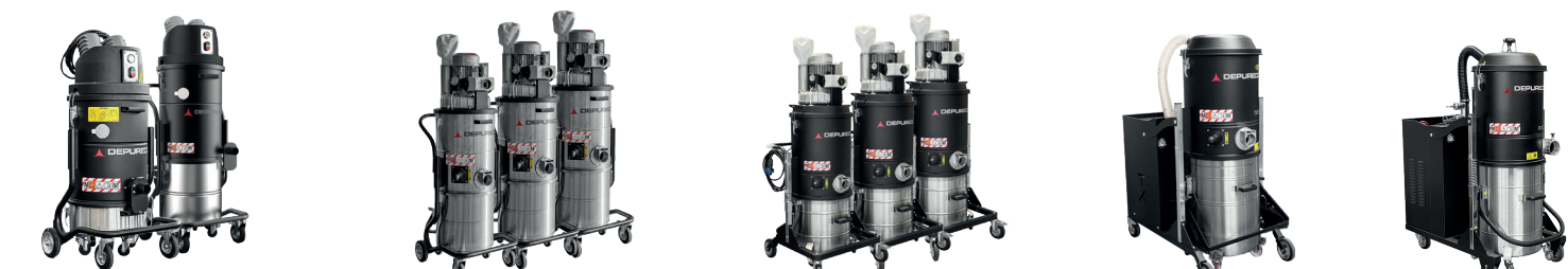
BL 20JC/45 ATEX Z22 TB M/T/PLUS ATEX Z22 ECOBULL M/T/PLUS ATEX Z22 SERIE TX ATEX Z22 SERIE FOX ATEX Z22