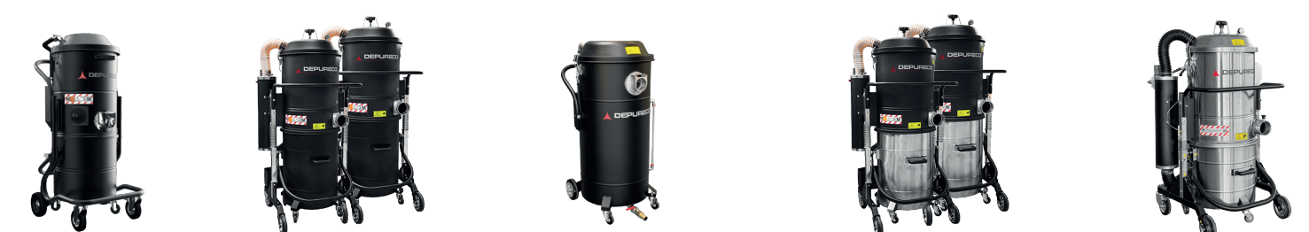
AC 65/100 WD AIR AC 65/100 ATEX Z22 AC Z21