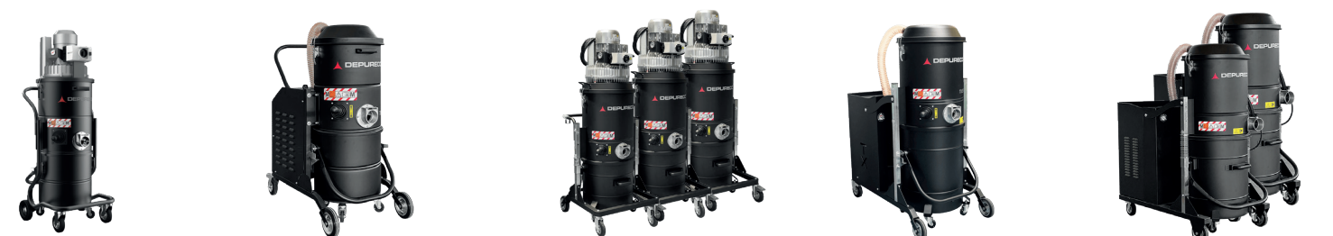
TB 22 TB UP M ECOBULL M/T/PLUS SERIE TX FOX 5,5/7,5 MINI AIR