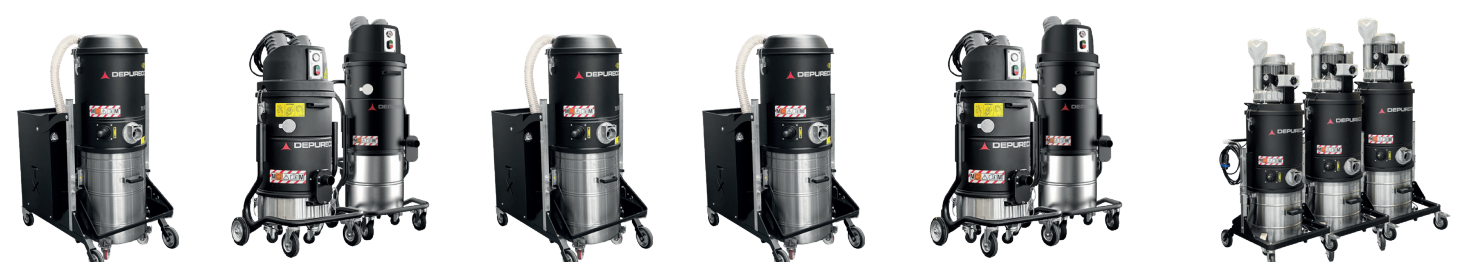
SERIE PUMA ATEX Z22 PUMA 30P/30S ATEX Z22 DV AIR ATEX Z22 SERIE HF ATEX Z22 SERIE FOX TS ATEX Z22 ECOBULL M/T/PLUS ADD. MANUFACTURING