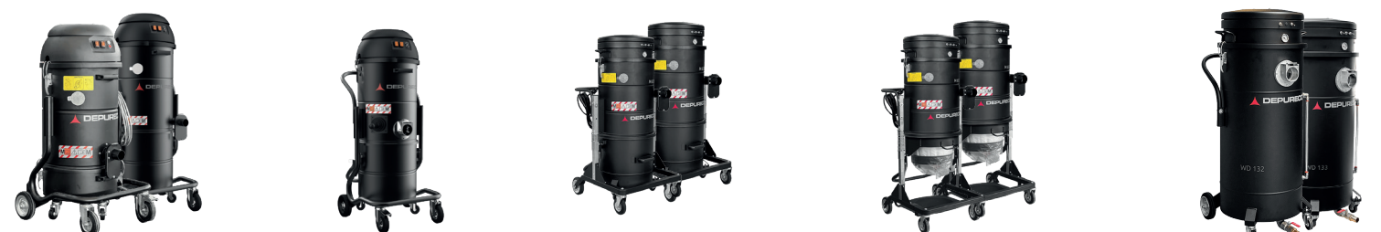
XM 20/35 JC MINI BULL M65/100 JC M65/100 LP WD 132/133 P