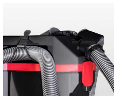
Courroie de transport multifonctionnelle.