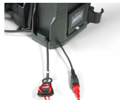
Câble d'alimentation enfichable et verrouillable avec dispositif de sécurité intégré.