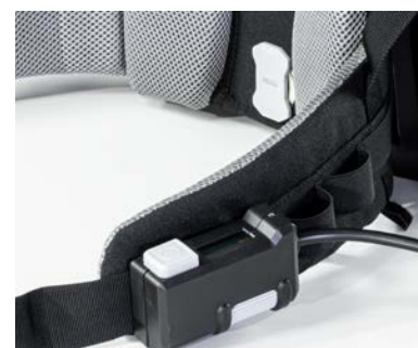
Panneau de commande avec bouton marche/arrêt et variateur de puissance.