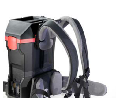
Harnais ergonomique, y compris sangle de poitrine et de hanche.