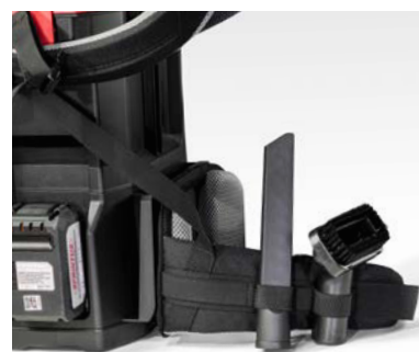
Quatre emplacements pour accessoires.