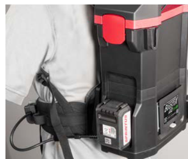
Centre de gravité bas avec une répartition optimale du poids.