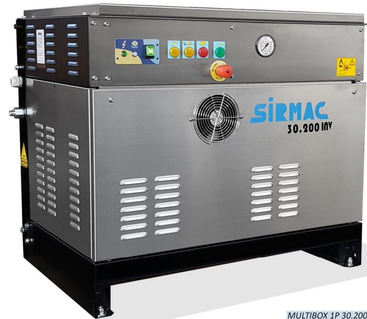
MULTIBOX 1P 30.200 INVERTER