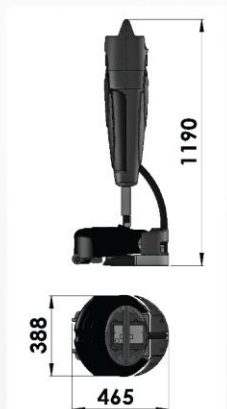
Les cotes sont indiquées en mm

Batterie Lithium-Ion : 36 Volts / 13 Ah de nouvelle génération qui supportent les charges fréquentes pour fournir 1 heure d'autonomie. C'est une machine de régie idéale pour répondre aux imprévus de tous les jours.