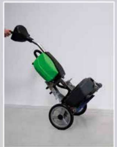
Chariot de transport pour escaliers