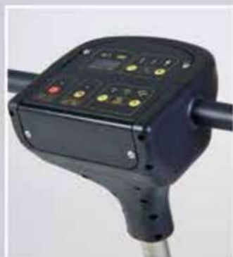
Affichage numérique avec poignée d'insertion de type monobrosse