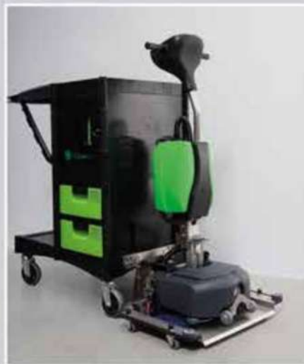
Système de nettoyage multiple avec PLASTIQUE RECYCLÉ avec plate-forme en acier inoxydable