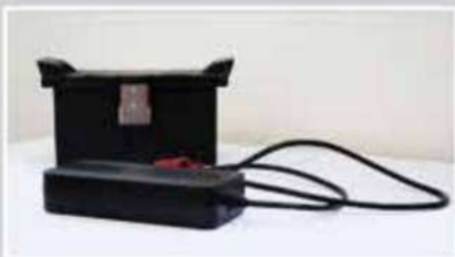
chargeur de batterie ventilé multi-tension