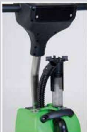
Système de filtration et flotteur à billes