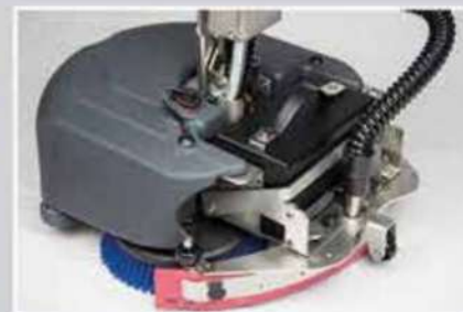
Avec batterie lithium