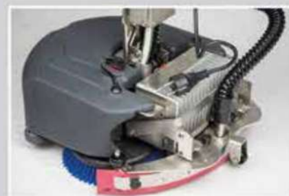
Avec câble multi-tension