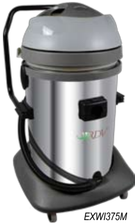
EXWI375M CUVE INOX

Equipé d'une anse pour le déplacement et d'un kit de vidange pour vider la cuve; l'aspirateur Excel à version 3 moteurs répondra à toutes vos exigences.