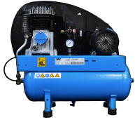
COM Compresseur a bord compresseur installée à l'arrière