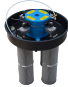
SP Décolmatage cartouches par injection air réseau air comprimé Filtre antistatique classe M (EN 60335-2-694, cartouches polyester antistatiques, 12 m 2 Surface filtrante