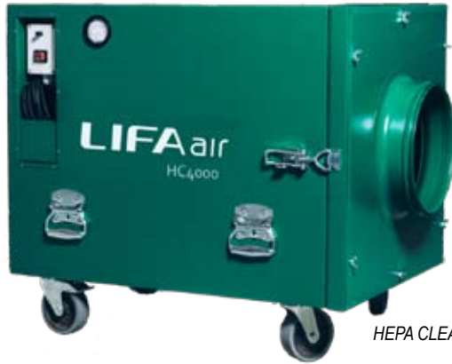
HEPA CLEAN 4000