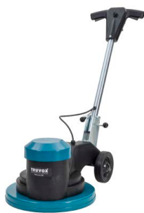
Orbis® eco 200