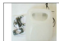
Réservoir de solution (5 litres)