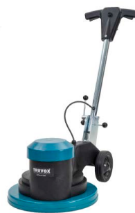
Orbis® eco 400