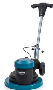
Orbis® eco Duo