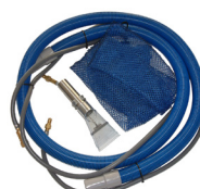
Kit outil de surface (tuyau + outil)