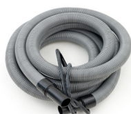
Flexible 6m (pression jusqu'à 100 psi)