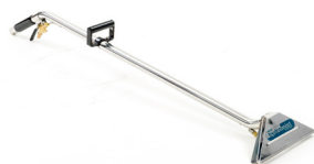
Canne en acier inoxydable - simple spray, pression jusqu'à 400 psi