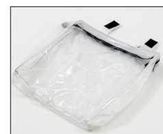
Sac de rangement pour le tuyau et l'outil revêtements textiles