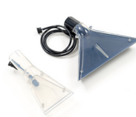
Kit outils sols et revêtements textiles