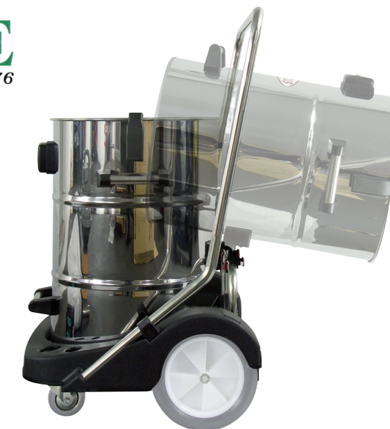
Équipement de base: La fonction de basculement permet un vidage ergonomique.

Pour le N 77/3 E, un embout d'aspiration XL de 650 mm est disponible en option pour une utilisation sur sols mouillés ; celui-ci est monté de manière fixe sur le socle de déplacement et est commandé depuis l'arrière de l'appareil.