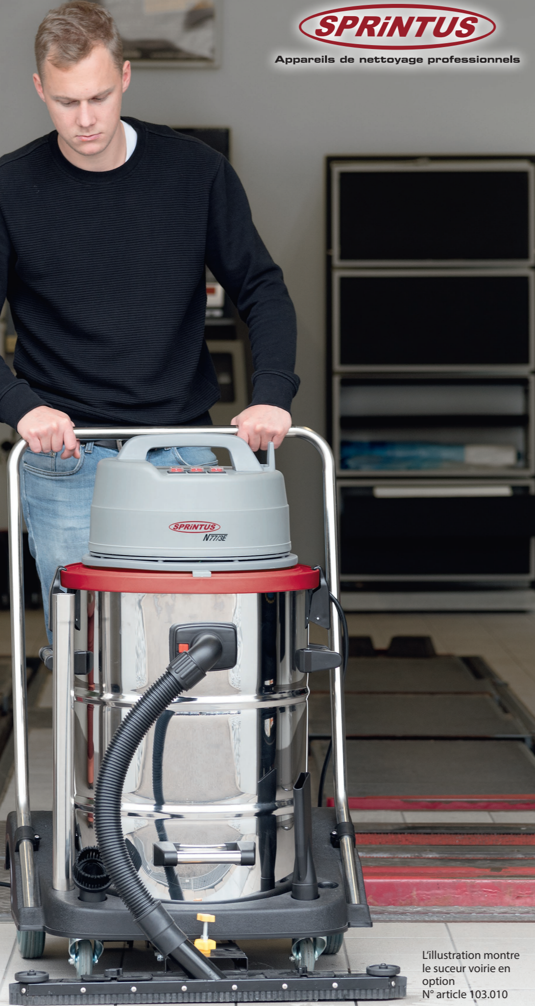
L'illustration montre le suceur voirie en option N° article 103.010