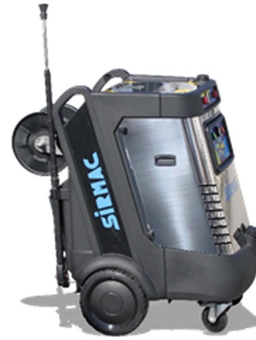
INDRA AVEC ENROULEUR OPTIONNEL

Productivité augmentée pour l'élimination de la salissure tenace, taches incrustées, huileuses et de graisse grâce à l'eau chaude qui permet de dissoudre plus rapidement la salissure, en optimisant les temps de travail et en réduisant l'utilisation des détergents. 🐾