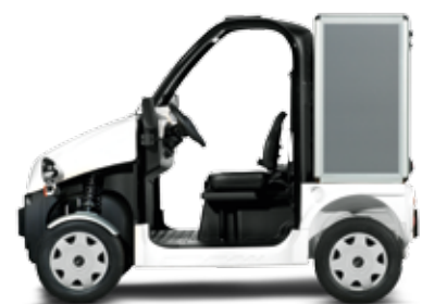
Pulse 4 L1 option + coffre ouverture à l'arrière