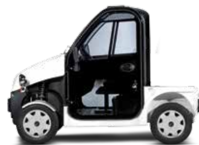
Pulse 4 L1 option porte en verre gauche et droite