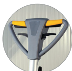
Poignée vue avant