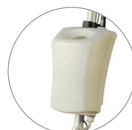
Réservoir 12 litres