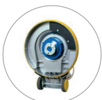
Raccord plateau entraîneur et brosses