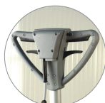
Poignée vue arrière