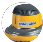
Nouveau couvercle en plastique (L22)