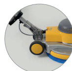
Articulation du manche