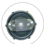
Réducteur à satellites et planétaire (L22)